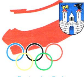
Regionalna Rada PKOl